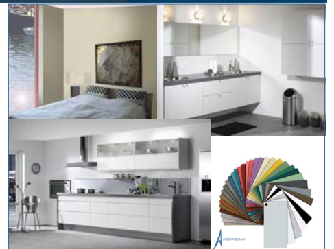
HTH køkken & bad